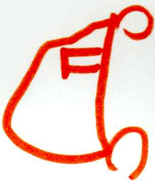
Μετά πέταξε στο διάστημα και έγινε διαστημόπλοιο.

Μια μέρα η τρελογραμμή φόρεσε την κόκκινη στολή. Ανέβηκε πάνω, πήγε ίσα μετά κατέβηκε και έγινε ένα ορθογώνιο.