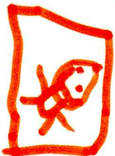
Έγινε το μαξιλάρι του αστυνόμου Αρκουδάκη