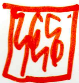
Μετά Γύρισε στη Γη και έγινε πσιόνα.