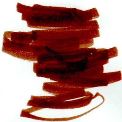
Μετά πέταξε στο διάστημα και έγινε διαστημόπλοιο.