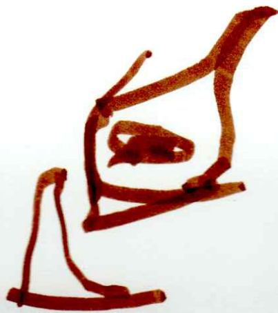
Μια μέρα η τρελογραμμή φόρεσε τη κόκκινη στολή. Ανέβηκε πάνω, πήγε ίσα μετά κατέβηκε και έγινε ένα ορθογώνιο.