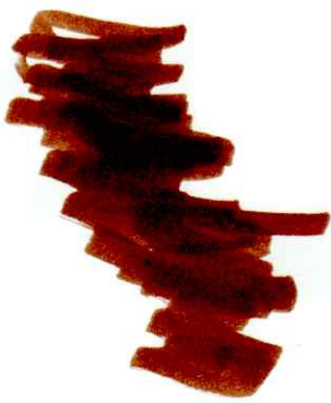
Από το μαξιλάρι το έσκασε η τρελογραμμή, πήδηξε από το μπαλκόνι και έγινε πόρτα σε ένα αυτοκίνητο.