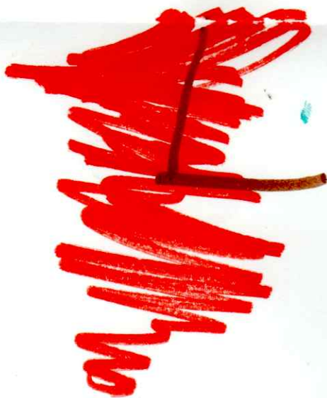
Βγήκε να στεγνώσει και έγινε πετούετα.