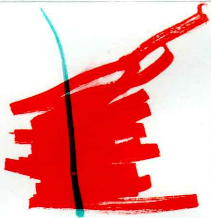
Μετά Γύρισε στη Γη και έγινε πισίνα.